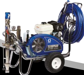
DUTYMAX™ EH230DI PROCONTRACTOR