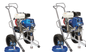
GMAX II IronMan 7900 (7900 HD)

Выдерживает сильные удары, обеспечивая стабильность потока и фильтрации